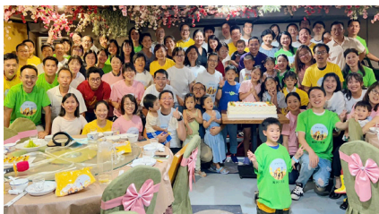
恩道教會六週年慶

2016年5月帶著不滿一歲、哮喘嚴重的兒子和兩歲多的女兒，舉家回國事奉的宣教士約書亞，當年8月第二週即開始建立恩道教會。至今年8月中，他服事滿六年，教會給他安息年假9個月。