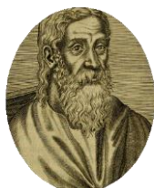
亞歷山大的克萊門

亞歷山大的克萊門（155-215）如此解釋說，基督徒不會為隱藏性關係的罪，「通過加速墮胎和使用墮胎藥物來徹底摧毀胚胎，也與它一道摧毀人類的愛，從而奪去照上帝旨意產生的人性。」 42