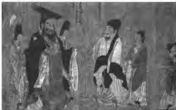
歷代帝王圖，局部，唐·閻立本繪

《聖經》但以理書4:32中說，“至高神在人的國中掌權”，上帝在人的國中掌權，主要是通過設立或者廢除君王實現的。上帝在巴比倫和波斯的作為，同樣反映在古代中國，具有普世性質。至於以色列人，則是一個祭司的國度，神直接帶領他們，通過立約的形式讓他們明白自己的特殊性質，耶和