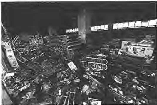
烏魯木齊“7.5”事件中死亡人數達到140人

三十年來，國家對少數民族地區的社會、經濟發展進行了大量投資，在物質建設方面取得了巨大的成就；然而在民族關係與信仰問題上，始終存在著不同程度的張力。2008年西藏拉薩