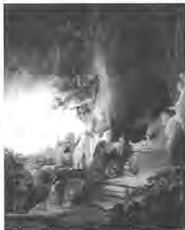
蘭布倫名畫：復活的基督向抹大拉的馬利亞顯現

基督復活是超自然的能力。自然律不能排除這樣的可能。而讓我們驚覺「這是神蹟」的，正是自然律！如果我們不知道自然律，即使看到神蹟也不會辨認。基督徒與霍金之觀點最大的不同為：基督徒不認為這個宇宙是封閉的因果系統，而相信，它向著造物主是敞開的，神可以主動在其中行事。