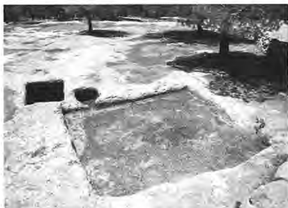
巴勒斯坦，榨酒池遺跡

鑿而成。葡萄成熟後堆在池中，人在上面踩，從而榨出葡萄汁，這種葡萄汁就是酒。這樣的葡萄園在古代巴勒斯坦地區很普遍。