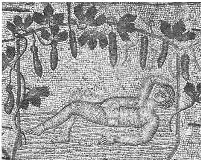
約拿躺在瓠子藤下，義大利亞奎大教堂 馬賽克拼貼畫，四世紀