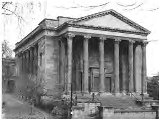
鄰近格拉思哥大學的威靈頓教會

莫里森……以頭腦也以心靈研讀聖經，……往往能從不起眼、為人所忽略的經文角落，挖掘出讓人驚異的寶貝。 George Morrison studied the Bible with both discerning mind and longing heart. He often dug out amazing treasures from neglected corners of the Scriptures.