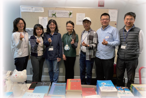
恩福同工和義工合影。