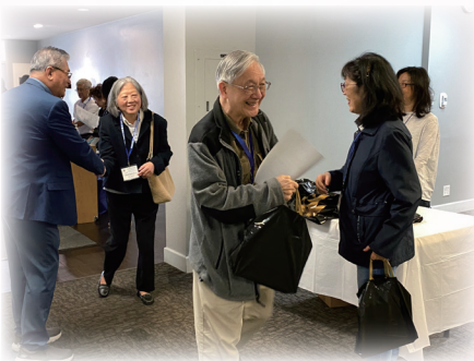
與各界教牧同工相見歡。