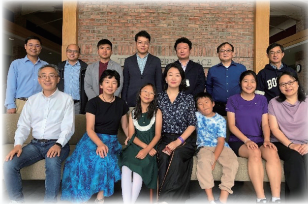
恩福參與者在會中合影。